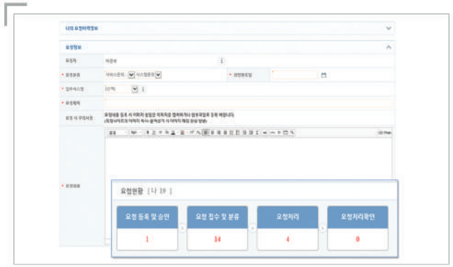
[ 서비스요청 ]