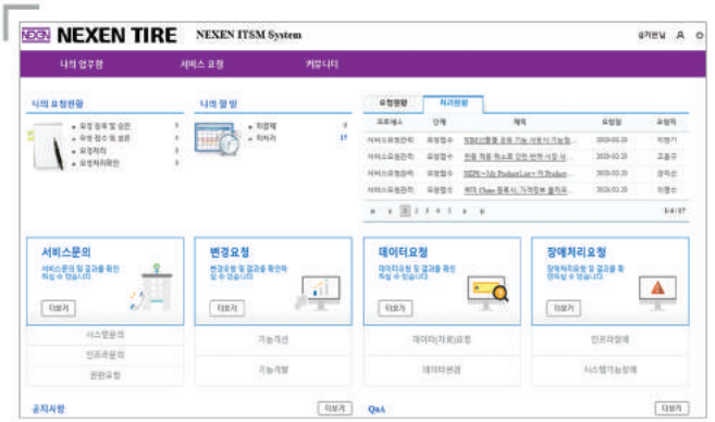
[ IT 포탈 ]