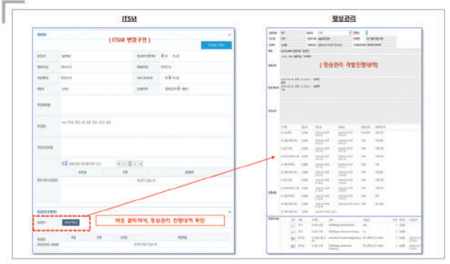
[ 변경관리 및 형상진행내역 ]